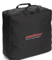
Transport- und Aufbewahrungstasche (Art. 19680)