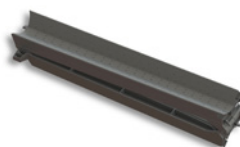
Auffahrschiene (faltbar) (Art. 19940)