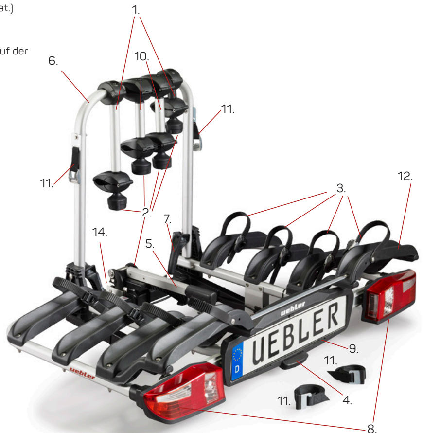
P32 S (Art. 15810)